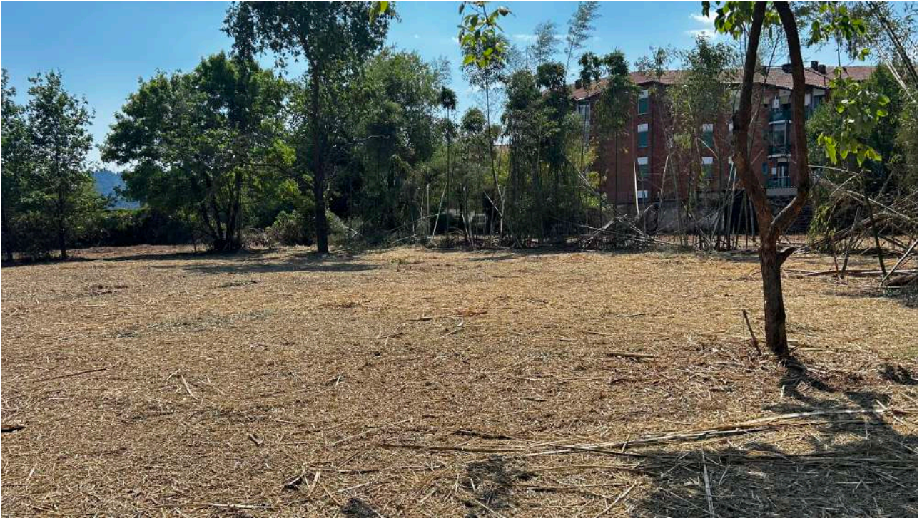
Foto dalla particella 94 verso i condomini confinanti