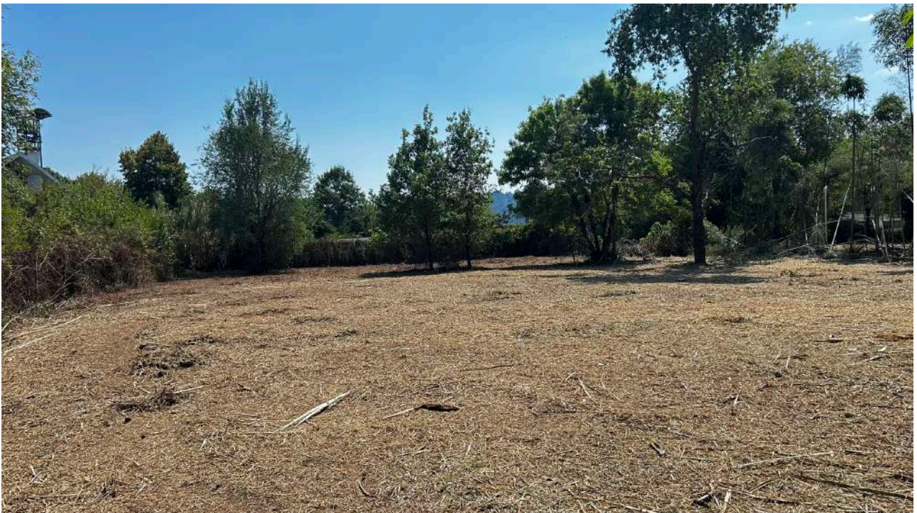
Foto verso sud della particella 92 sulla sinistra si notano le strutture della Chiesa Madonna del Rosario