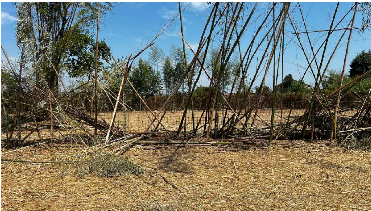
Foto della recinzione che separa la particella n 94 dalla n 73

È presente una seconda recinzione che separa la particella n 94 dalla n 93.