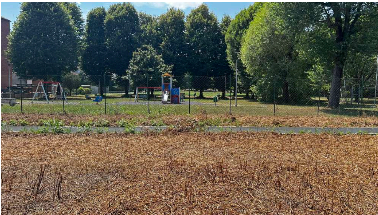
Foto della recinzione che separa la proprietà del Giardini De Gasperi

I terreni sono stati utilizzati in passato come orto privato, l'area è recintata lungo il perimetro, indicato con la polilinea rossa nella foto aerea, per separare le aree dal giardino pubblico confinante, Giardino De Gasperi.