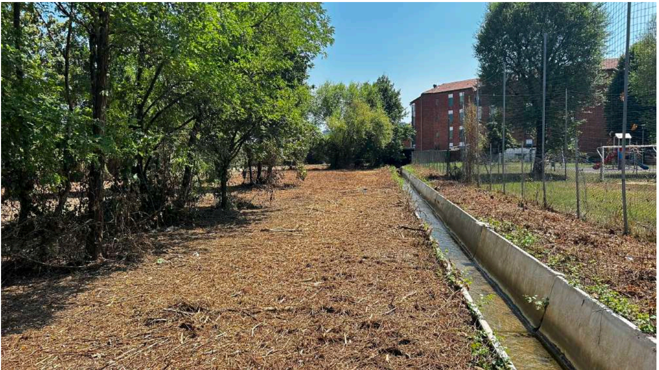
Formazione lineare di vegetazione arborea arbustiva

È presente una formazione lineare composta da alberi di Robinia e arbusti di Ligustro spontanea che si sviluppa parallela al confine con il giardino pubblico.