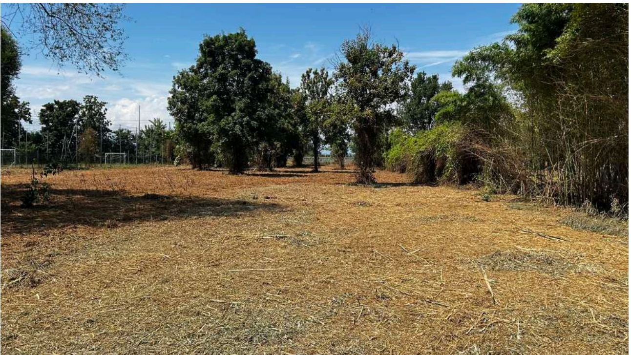
Foto della particella 94 verso nord