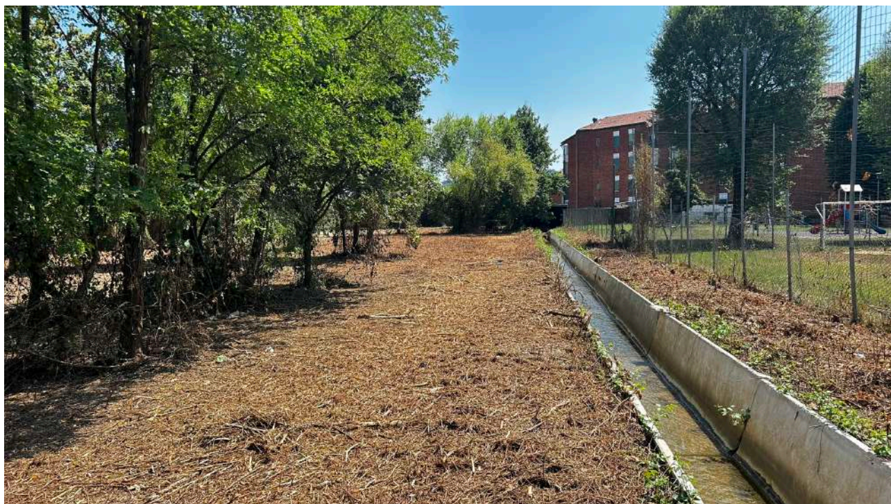
Formazione lineare di vegetazione arborea arbustiva

È presente una formazione lineare composta da alberi di Robinia e arbusti di Ligustro spontanea che si sviluppa parallela al confine con il giardino pubblico.