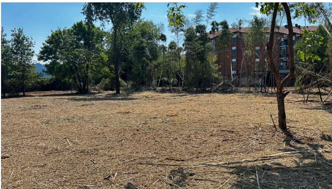
Foto dalla particella 94 verso i condomini confinanti