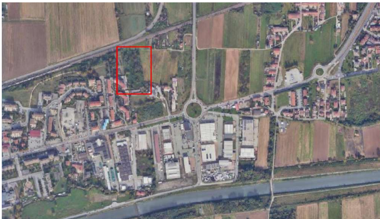
Inquadramento dell'area oggetto di relazione