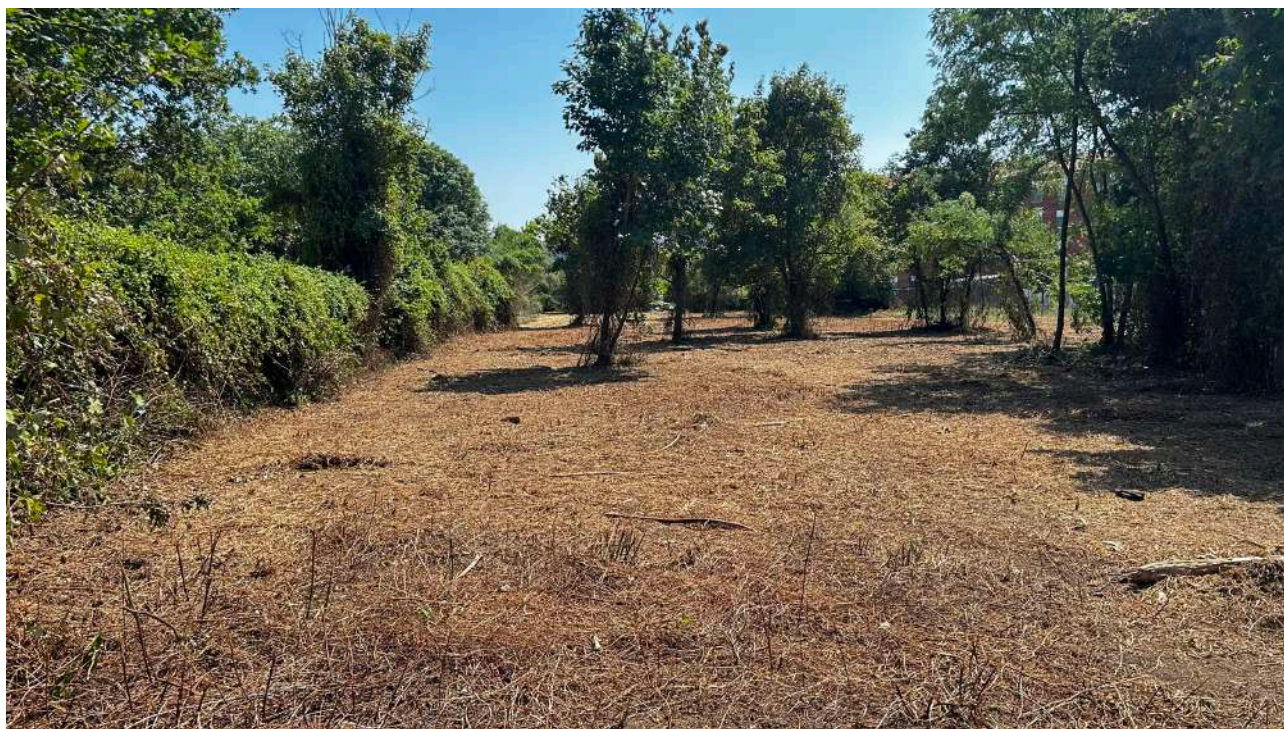
Foto verso nord della particella 92