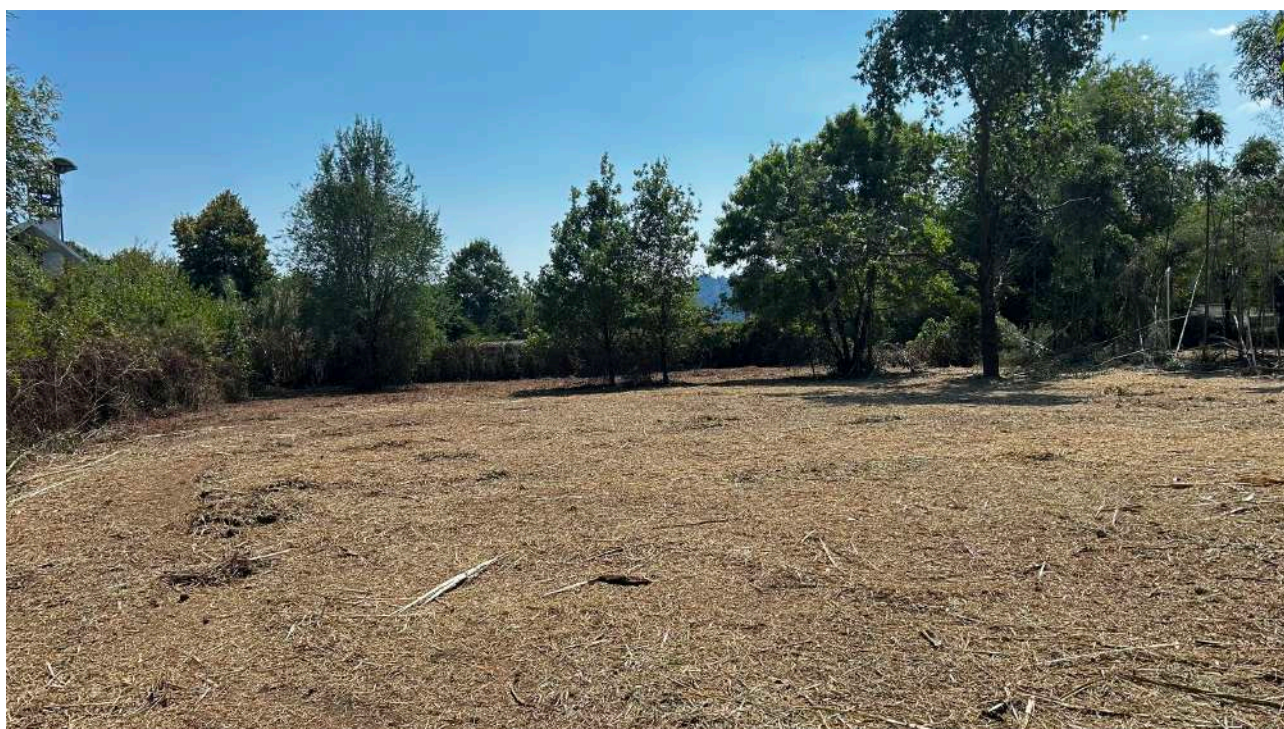
Foto verso sud della particella 92 sulla sinistra si notano le strutture della Chiesa Madonna del Rosario