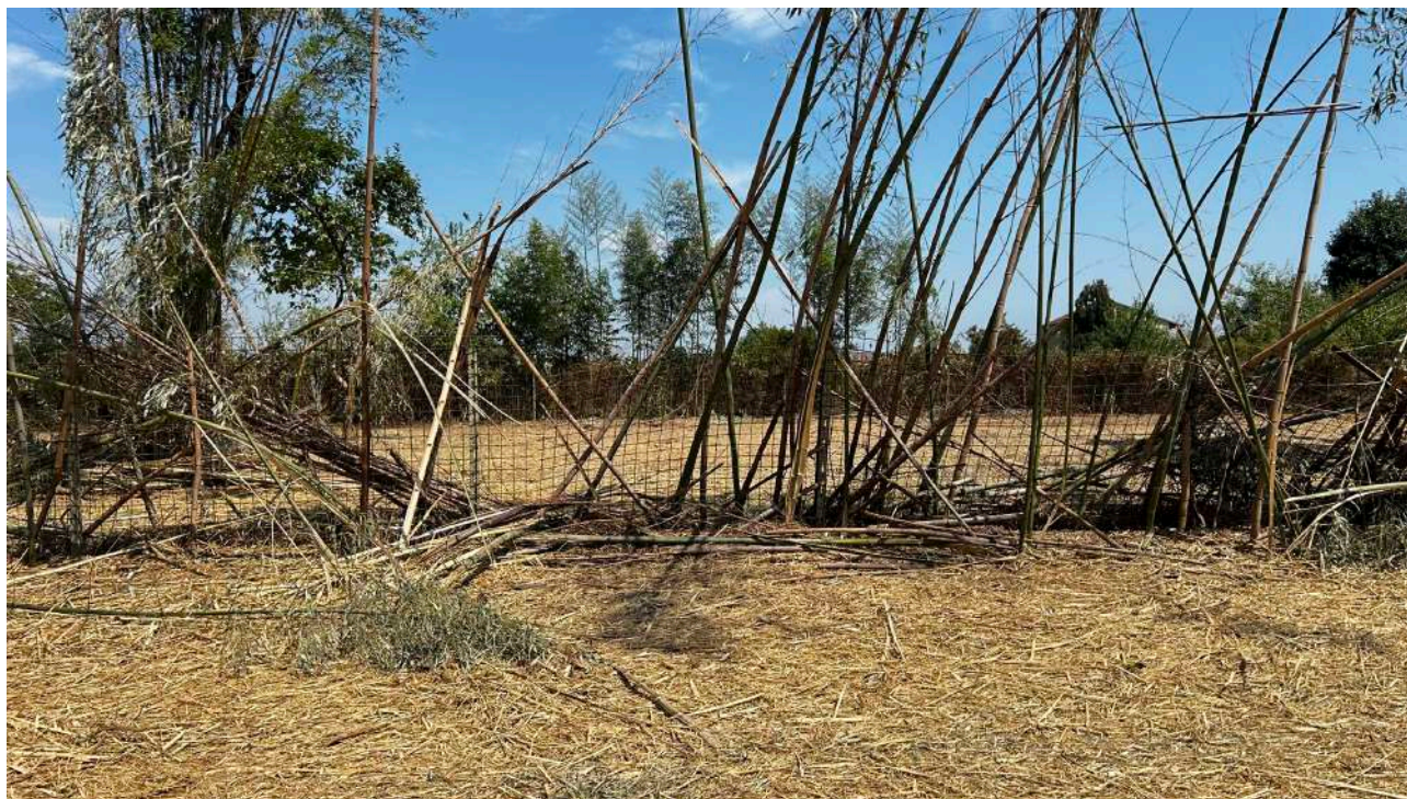
Foto della recinzione che separa la particella n 94 dalla n 73

È presente una seconda recinzione che separa la particella n 94 dalla n 93.