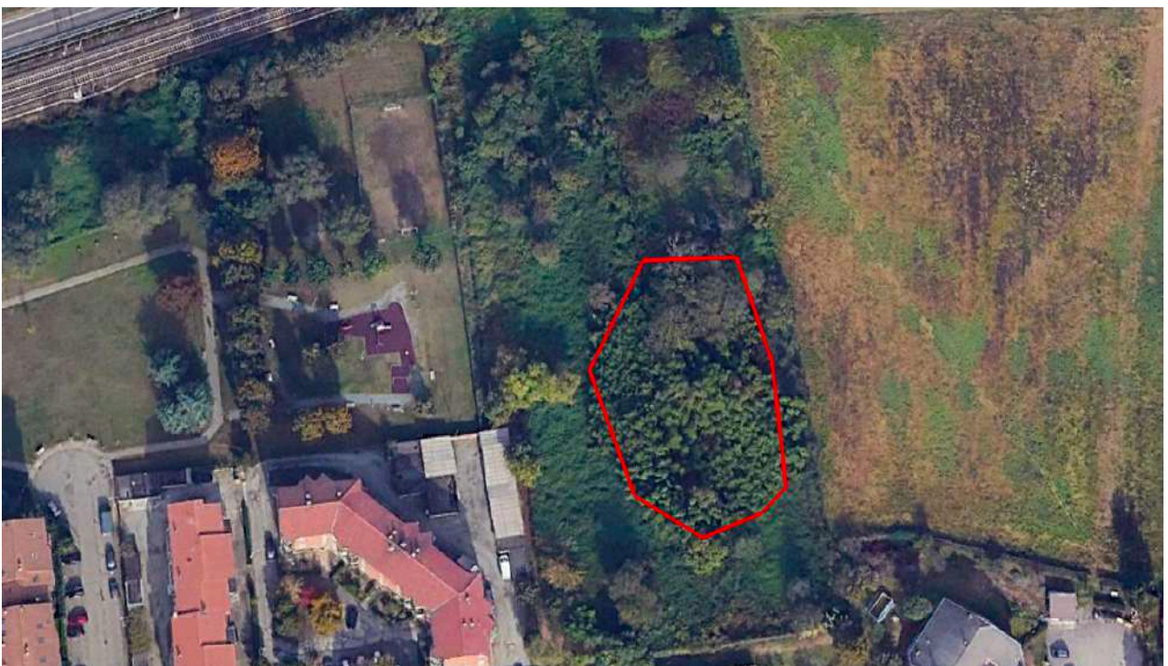
La macchia arborea oggetto di misurazione

Sono presenti macchie arboree di pochi esemplari arborei ubicati nella parte centrale dell'area a copertura delle strutture rilevate la cui area misurata a terra alla base esterna dei fusti è di mq 1.765,00