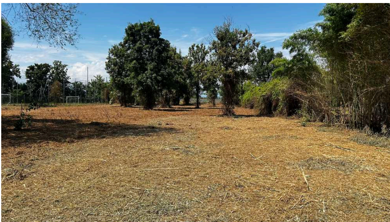
Foto della particella 94 verso nord