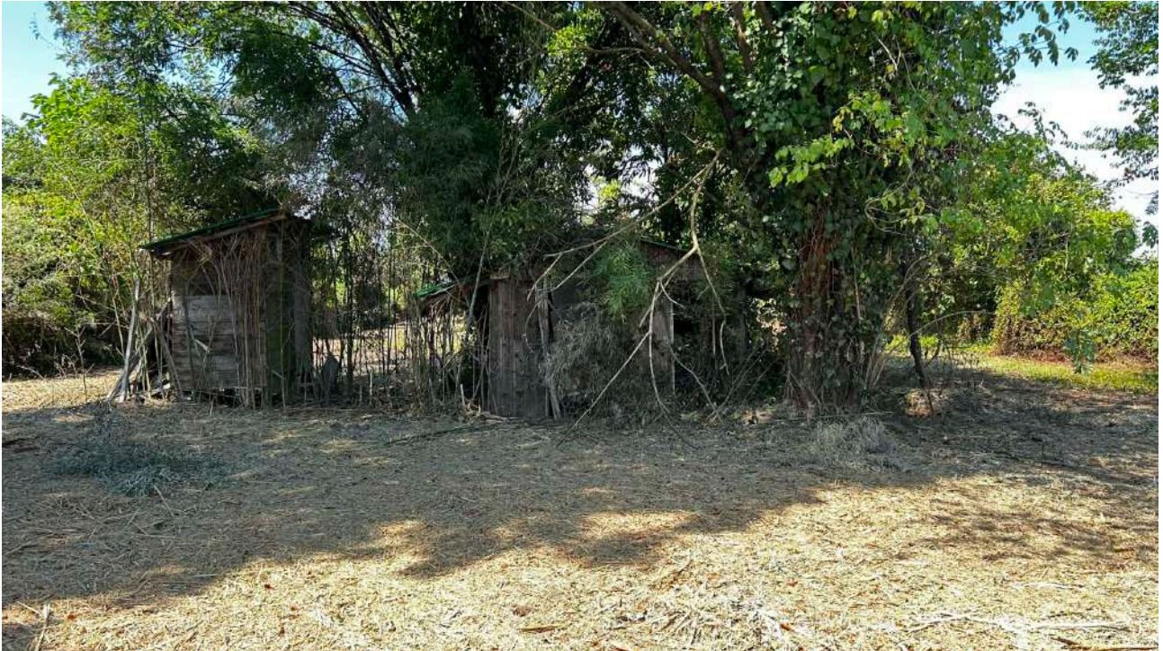
Foto delle strutture esistenti in stato di abbandono

Nell'area sono presenti vecchie strutture abbandonate.