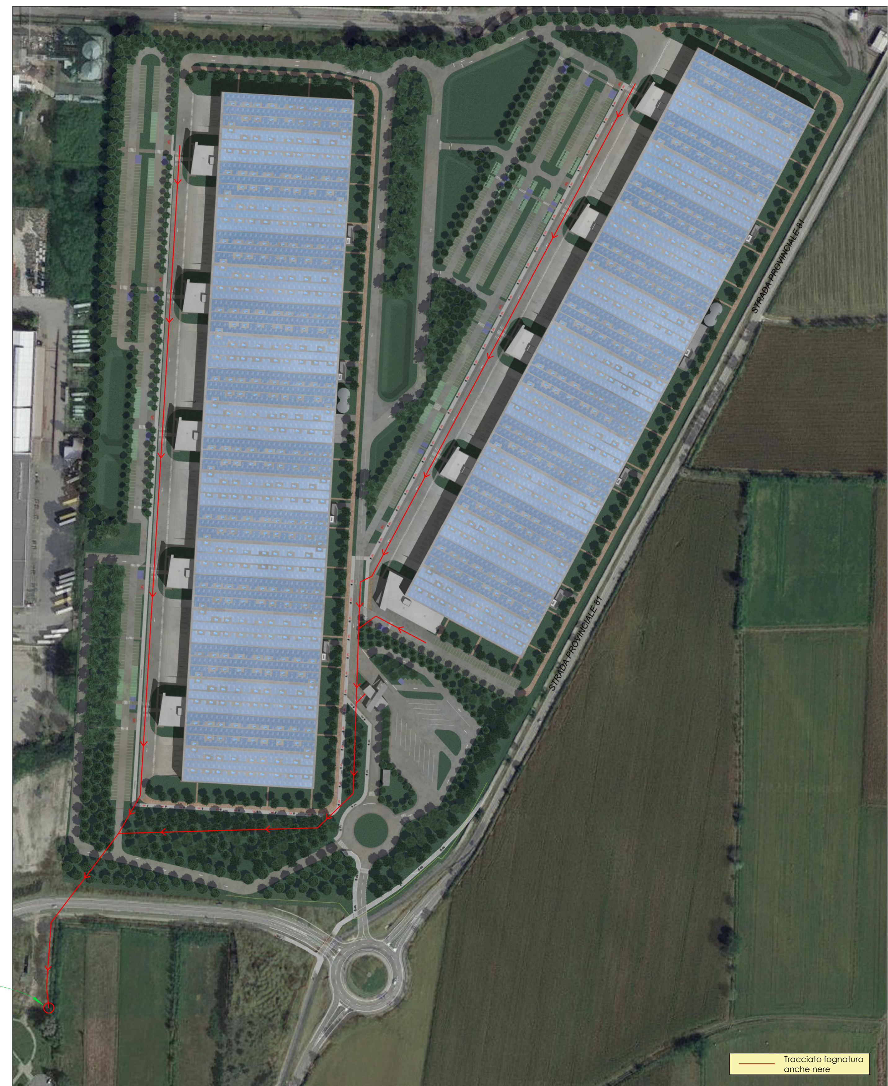
FOTOINSERIMENTO - Scala 1:2000

SMAT - Esempificazione schemi di allaccio alla fognatura nera comunale