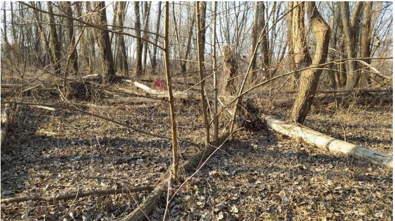
Presenza di diversi alberi schiantati