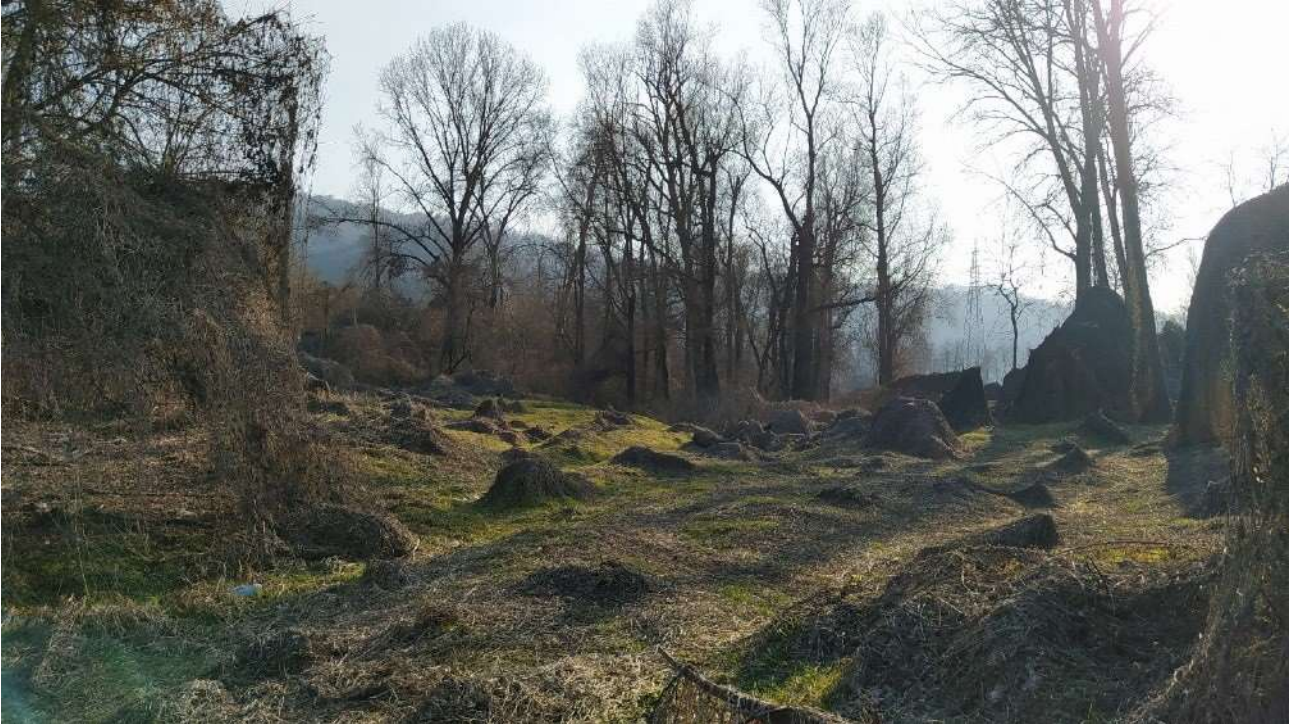
Area invasa dal Sycios