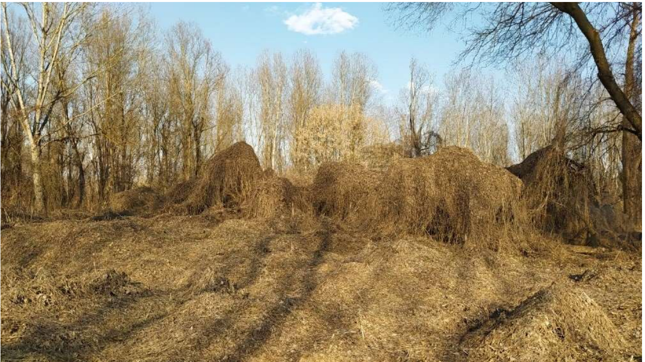
Area invasa dal Sycios