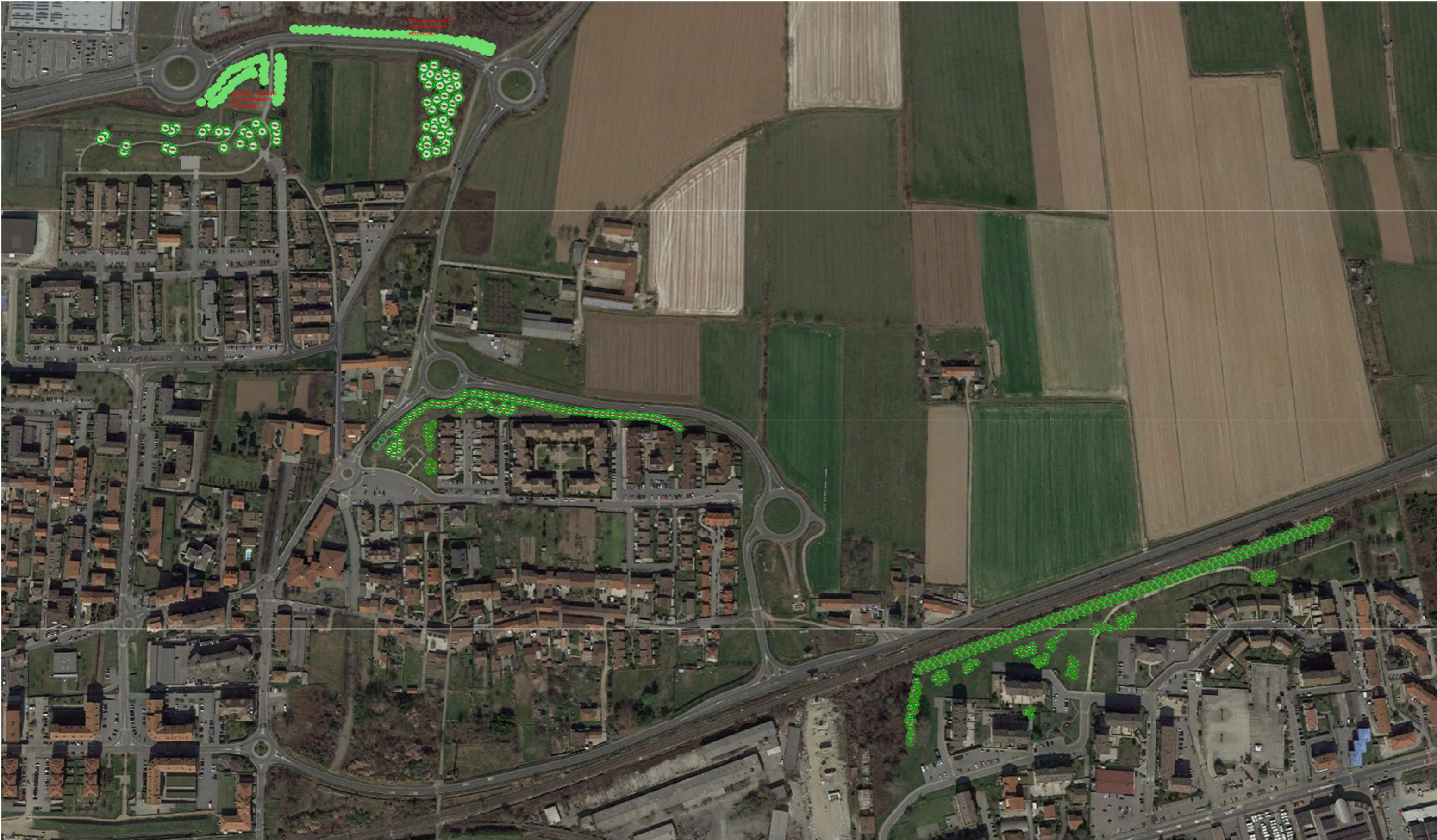
Fig. 2 - PLANIMETRIA COMPLESSIVA DEGLI INTERVENTI COMPENSAZIONE CONSUMO DI