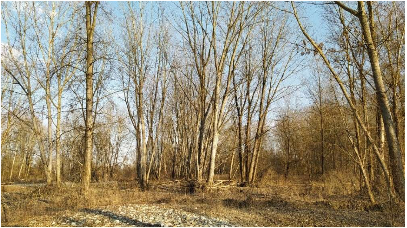
Area a prevalenza di Populus alba