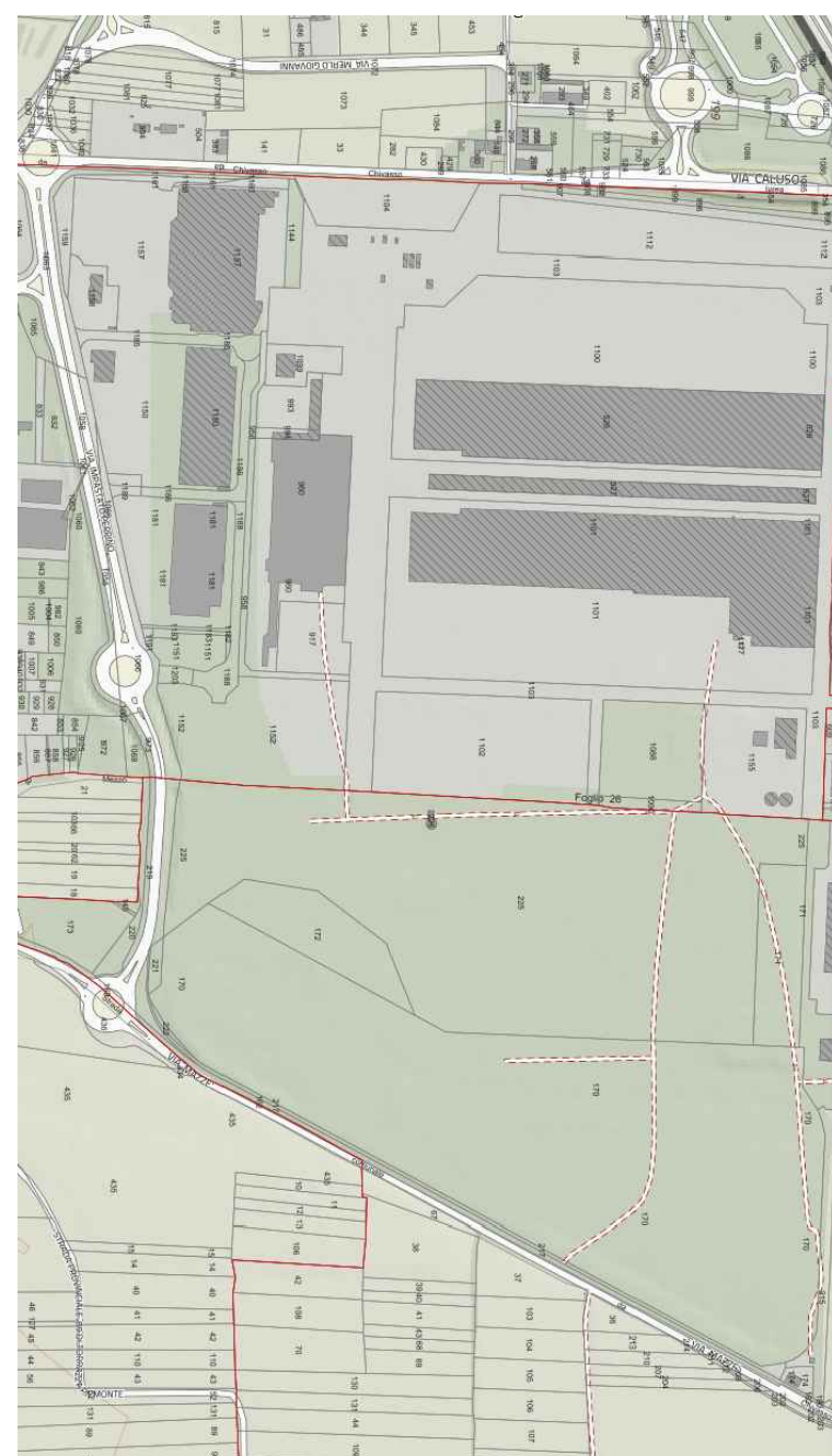
ESTRATTO GEOPORTALE REGIONE PIEMONTE

Data: APRILE 2022 Scala 1:2000 ELABORATO VERIFICATO Geom. Mariachiara Leo Ing. Elisabetta Scaglia